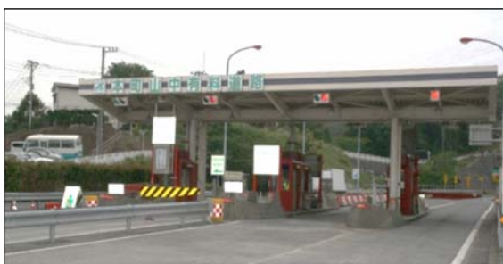
本町山中有料道路